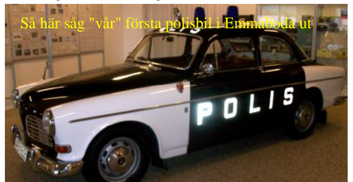
Så här såg "vår" första polisbil i Emmaboda ut