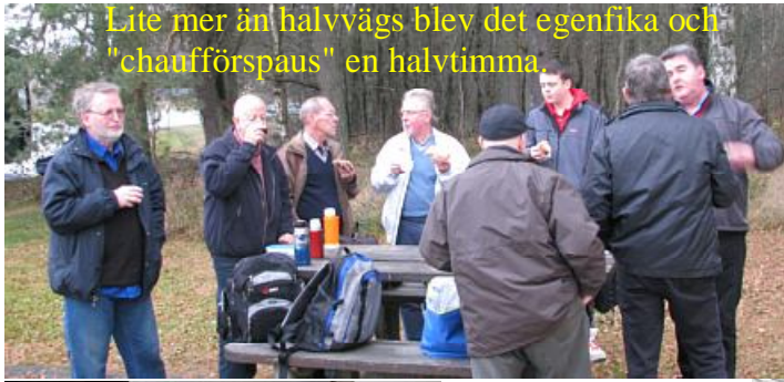
Lite mer än halvvägs blev det egenfika och "chaufförspaus" en halvtimme.