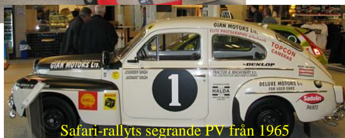
Safari-rallyts segrande PV från 1965