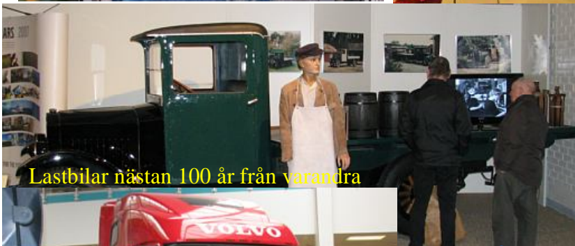
Lastbilar nästan 100 år från varandra