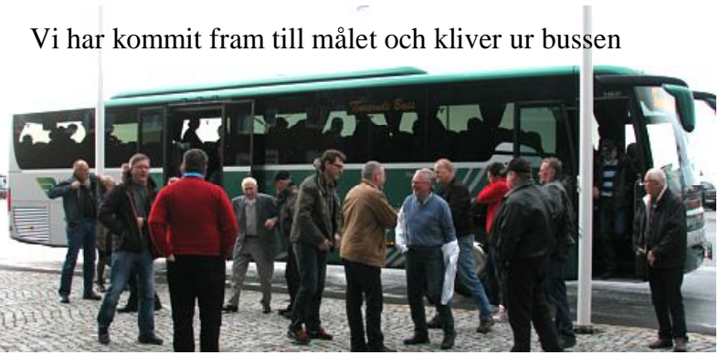
Vi har kommit fram till målet och kliver ur bussen