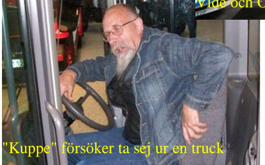
"Kuppe" försöker ta sej ur en truck