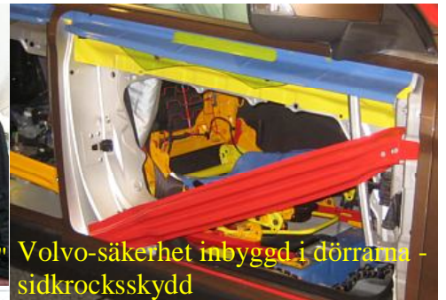
Volvo-säkerhet inbyggd i dörrarna - sidkrocksskydd