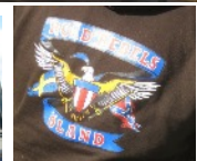
Road Rebels Öland